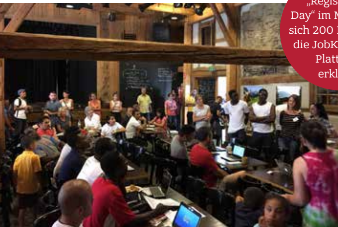
Beim „Registration Day“ im Mai ließen sich 200 Menschen die JobKraftwerk-Plattform erklären

Mit einer Art XING für Geflüchtete will die elobau Stiftung Arbeitssuchende und Firmen schneller vernetzen. Eine Idee mit Profil